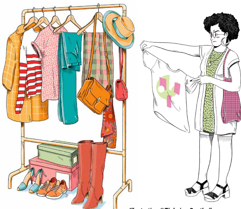
Illustration ©Tiphaine Gantheil